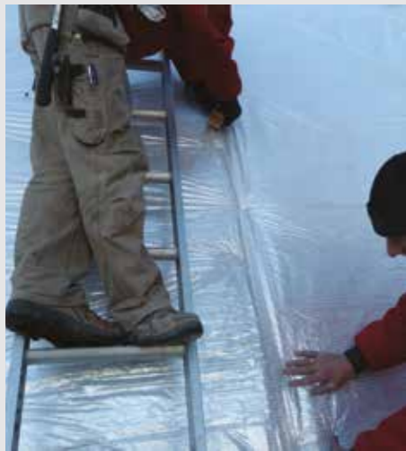
Banen onderling vastzetten met tape