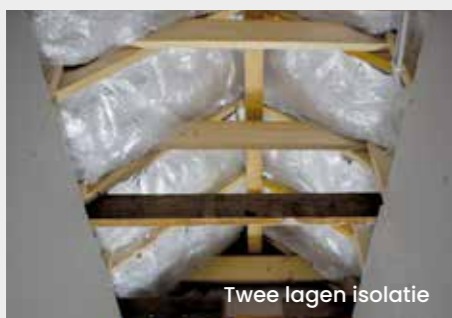
Twee lagen isolatie

Isobooster Professional is onze meest robuuste lijn die voldoet aan de hoogste waarden. Sinds 2021 is het product voorzien van de BCRG-Kwaliteitsverklaring. We zien dat hiermee zelfs monumenten op het hoogste isolatieniveau conform NTA8800 worden gebracht.