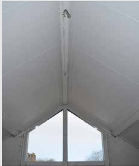
Zolders in één dag isoleren met het Isobooster Hellend dak Systeem (HDS)