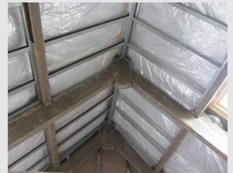
Bij dakisolatie met metaalstud blijven authentieke dakbalken zichtbaar