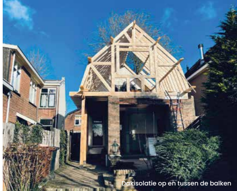
Dakisolatie op en tussen de balken