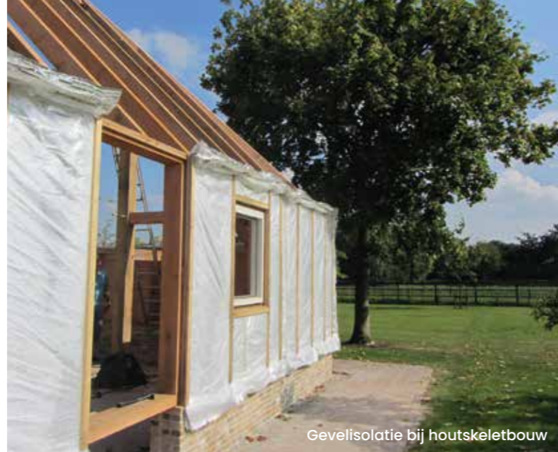
Gevelisolatie bij houtskeletbouw

* Gebaseerd op cijfers van Essent (2019-2020)