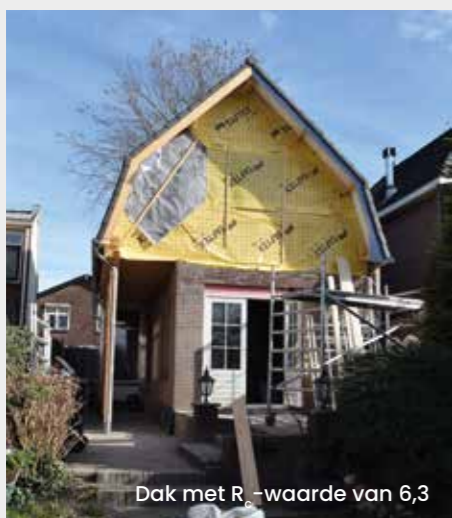
Dak met R w -waarde van 6,3