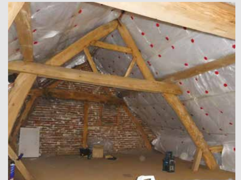
Verduurzaming van historische vakwerk kap