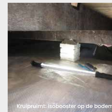
Kruipruimte: Iso booster op de bodem