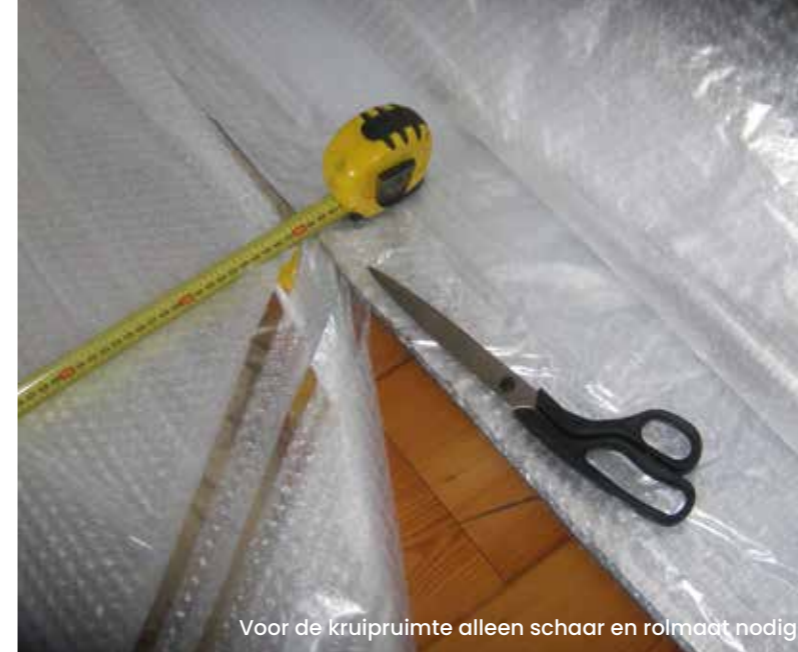
Voor de kruipruimte alleen schaar en rolmaat nodig

E. van de Beek | B&B Vastgoedontwikkeling