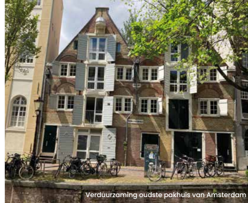
Verduurzaming oudste pakhuis van Amsterdam