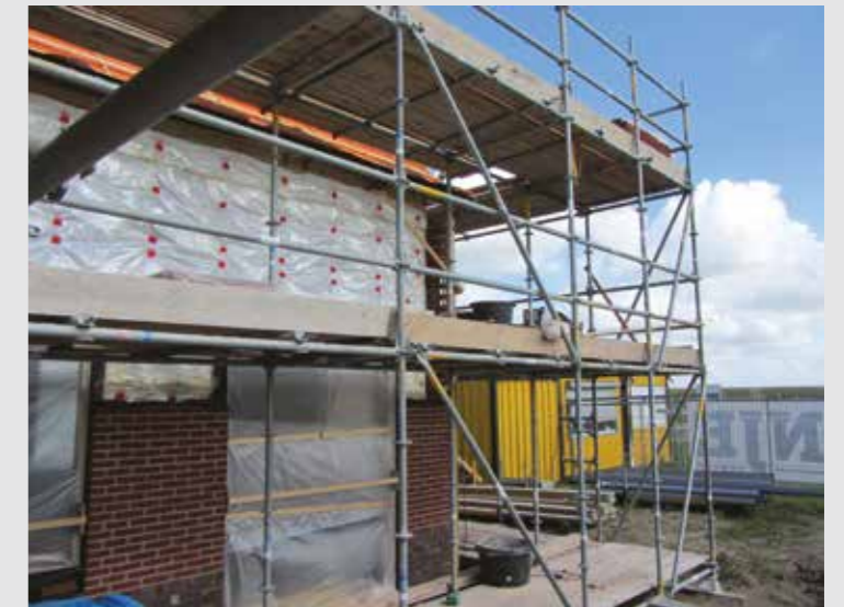
Spouwisolatie bij nieuwbouwwoningen

Isobooster wordt standaard geleverd op rollen van 1200 mm en 600 mm. Door de ingebouwde overlap van 50 mm monteert je snel banen naast of onder elkaar met naadloze aansluitingen. Met de speciale Isobooster tape worden de banen aan elkaar vastgezet. Je kunt Isobooster knippen of snijden met een schaar of mes. Isobooster wordt geleverd in een beschermende verpakking.